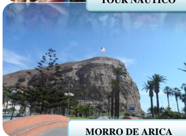
MORRO DE ARICA