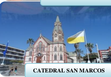
CATEDRAL SAN MARCOS