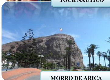
MORRO DE ARICA