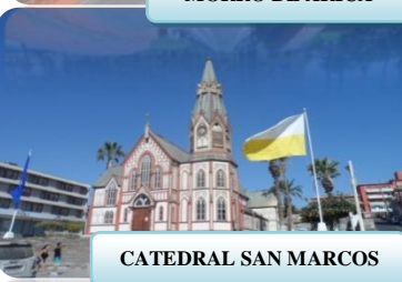
CATEDRAL SAN MARCOS